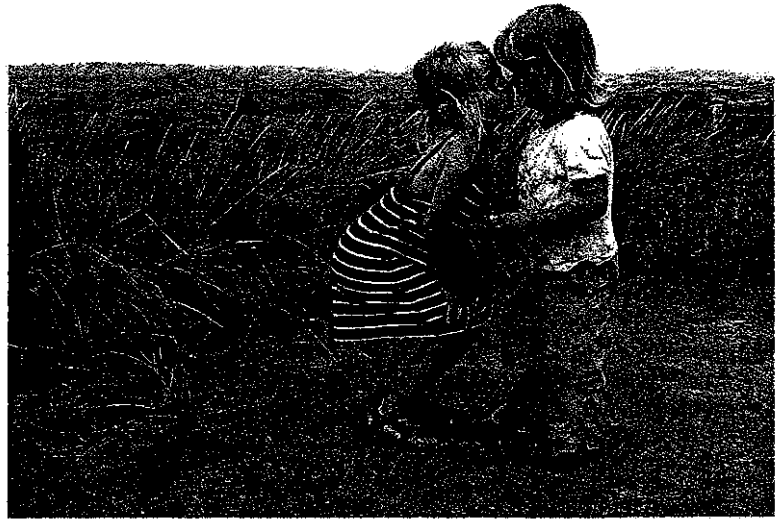
La reparació, que té com a finalitat compensar el mal causat i alleujar les culpes, es basa en el reconeixement de l'altre i en el mal causat

Estar en contra de qualsevol tipus de càstig no significa, però, que s'hagin de permetre les conductes inapropiades ni els danys que puguin causar. Cada criatura ha introjectat des de ben aviat unes determinades pautes de conducta al si de la seva família i ha après determinades formes de respondre als estímuls ambientals